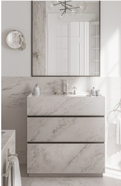
ROBINETTERIE – SALLE DE BAINS BATHROOM FITTINGS