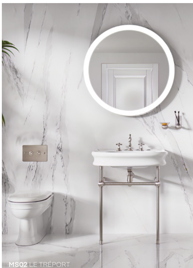
MS02 LE TRÉPORT