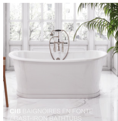
CIB BAINOIRES EN FONTE / CAST-IRON BATHTUBS