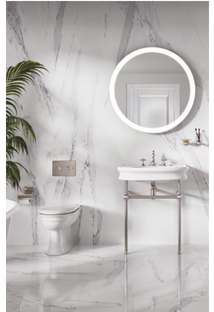
SANITAIRES SANITARY WARE

Margot offre des ensembles complets pour la salle de bains : robinetterie et accessoires, mais aussi un panel d'équipements sanitaires tel que des lavabos, WC et baignoires.