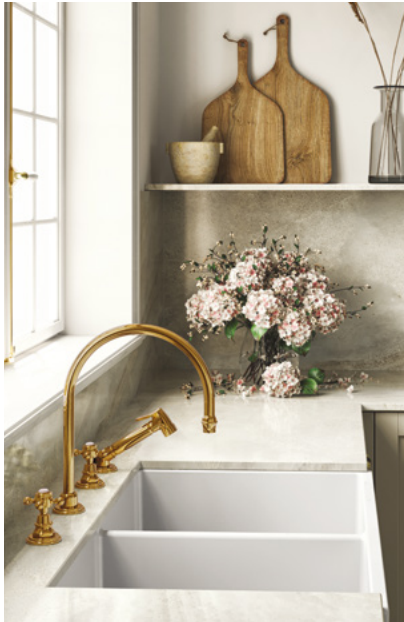
ROBINETTERIE – CUISINE KITCHEN FITTINGS