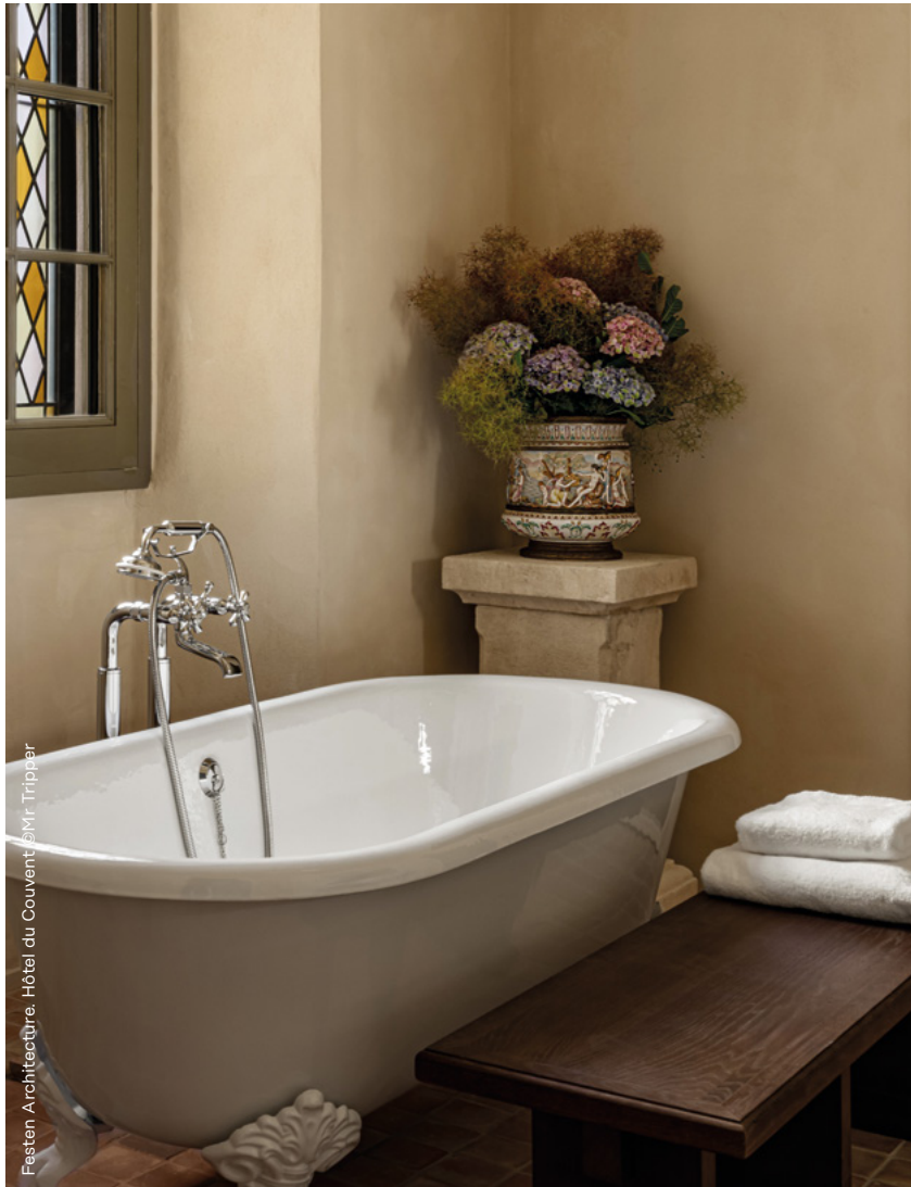
Festen Architecture. Hôtel du Couvent

MAÎTRES ROBINETIERS DE FRANCE THE FRENCH BRASSWARE MANUFACTURERS